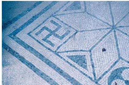
Hakenkruis Herculaneum religionforums.org

In Pompeï, in Herculaneum, is het hakenkruis nog merkwaardiger. Indien we de reacties van de toeristen mogen geloven, is het zeer obscuur en bestaat er geen enkele twijfel over de oorspronkelijke betekenis van dit symbool. (2)