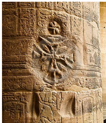
Pilaar Tempel van Philae - Egypte

Deze verwarring die Keizer Hadrianus aanhaalt, komt voort, zoals we zullen zien, uit eenzelfde praktijk van gebruik van het kruis.