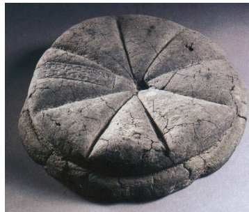
Brood Herculaneum - Italië rubico.nu

ter van 'het komende leven'. Inderdaad, niet enkel op de vertegenwoordigers van Dyonisos - op de frontale banden van zijn priesters, op de Italo-Griekse vazen - zoals men dit kan zien in de rijke collectie van het Louvre, vinden we het kruis, maar ook op de mystieke broden. Het is nu niet meer het voorrecht van de 'ingewijden', van de 'priesters'. Het is het regelmatig kruis met gelijke takken, het Griekse, zichtbaar op ontelbare monumenten. Wie het museum en de opgravingen van Herculaneum heeft bezocht, kon deze broden, die opgediend werden tijdens de gewijde "orgieën" en op wonderbaarlijke wijze bewaard werden door de assen van de Vesuvius, zien. Het kruis is gekerfd in de korst van het brood.