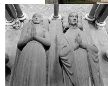
Pierre Abélard en Héloïse 1st-art-gallery.com

Op een stuk grond van 100m 2 met omrastering staat hun praalgraf, een neogoo-