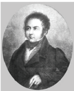
Fabre d'Olivet Martiniste.org

Om niet te verdwalen, lopen we terug naar de Avenue Principale, die we rechts inslaan, dus steeds dieper het domein in. De 2 de blok aan onze rechterhand, is de