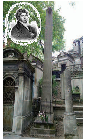
Jean-François Champollion en.wikipedia.org

We verlaten de 17 de afdeling en lopen naar de Avenue des Acacias, waar we, niet ver van de rotonde, aan de rand van de 18 de afdeling, het graf van Champollion aantreffen.