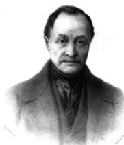
Auguste comte nl.wikipedia.com