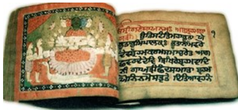
Dasavatara manuscript www.spiritualia.be

en wordt uitvoerig geciteerd in de Bṛhadāraṇyakopanisad , de “geheimleer van het grote woudboek”. Dit laatste is één van de belangrijkste werken uit de wereldliteratuur. Zoals men zegt dat heel de westerse wijsbegeerte slechts een reeks voetnoten is bij Plato, zo kan men nagenoeg de hele hindoe-boeddhistische overlevering tot Yājñavalkya terugvoeren.