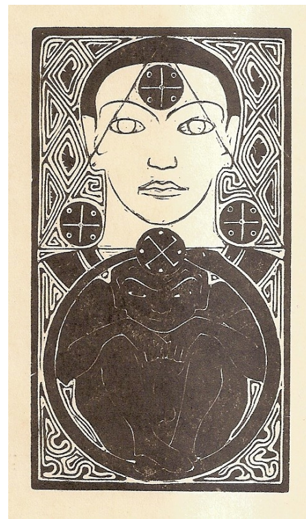
6. Het Hogere Zelf en Tanhâ

Vooraan zit een persoon in devote houding te kijken naar de figuren achteraan. Deze staan op golven, bovenop twee muurtjes, waartussen we een landschap met een berg of piramide vermoeden. Het zijn wellicht Egyptische priesters. Tussen hen in, zien we een cirkelvormig raam met het zegel van de Theosofische Vereniging. De priester rechts strekt beide handen uit naar de ander, in een gevende of uitstralende houding. Die aan de linkerzijde strekt zijn linkerhand, dus de ontvangende hand, uit naar de andere priester. Zijn rechterhand, of uitstralende hand, richt hij naar beneden, naar de persoon op de voorgrond.