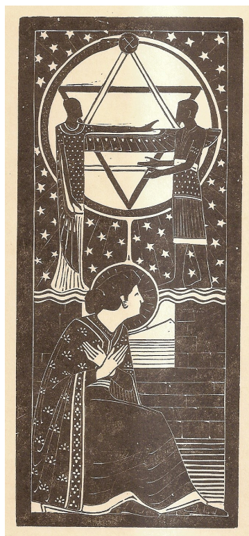
5. In de ruïnen ener Tempel II

Krishna als verlosser staat rechtsboven en straalt met alles wat kan stralen: zijn haar, zijn baard en zijn staf. Uit de stralen ontstaan drie hoofden, waarbij uit hun mond een lange tong steekt, of een energiestroom? Linksonder zit een mens aan de arbeid. De vrucht van zijn arbeid lijkt opgenomen te worden in de staf van Krishna en via deze weer verder te stromen. Zeker een allegorisch tafereel, maar niet eenvoudig te duiden!