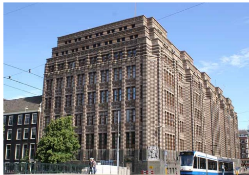
de Bazelgebouw Vijzelstraat - Amsterdam

harmonische stijl, gebaseerd op de leringen van de theosofie en wiskundige en meetkundige principes. De grote lijnen van de composities bestonden uit bogen, cirkels en driehoeken, die gebaseerd waren op de wiskundige harmonieën van mens, natuur en kosmos. We geven verder enkele voorbeelden hiervan uit het werk van de Bazel.