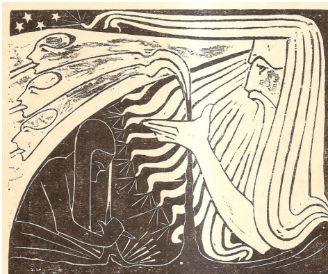
Krishna - De Verlosser aan de Arbeid

Deze plaat lijkt me moeilijk te interpreteren, zonder toelichting van de kunstenaar. Autarchie betekent normaal een systeem dat in al zijn behoeften kan voorzien zonder hulp van buitenaf. Minstens een streven naar onafhankelijkheid van anderen. We zien drie figuren met hoofddeksels die Egyptisch of Babylonisch aandoen. De centrale man heeft boven zijn hoofd een driehoek met op de hoekpunten een stralende cirkel of bol. Symbool voor de monade in zijn drievoudige stralenmanifestatie? Het wezen heeft 4 armen. Rechts onder hem staat een man die discussieert, onderhandelt of filosofeert? Links onder, staat een derde figuur, afzijdig, maar bevreemd?