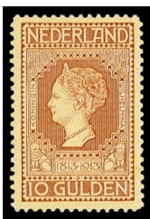
Opdracht jubileumpostzegel voor Koningin Wilhelmina

Minder gekend is zijn werk als grafisch kunstenaar. Hij was ook ontwerper van tuinen, logo's, ornamenten, postzegels en versierselen voor huis en drukwerk.