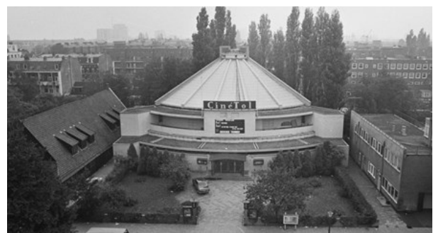
Theosofische 'Tempel' Tolstraat - Amsterdam www.gahetna.nl

Op oude foto's zien we, links van de Tempel, het houten hulpgebouw van de T.V., ontworpen door de Bazel. Toen het huidige gebouw, aan de andere zijde van de Tempel dus, in gebruik werd genomen, kreeg het hulpgebouw andere bestemmingen. De gemeente Amsterdam huurde het een tijd af en kocht het uiteindelijk over. Het werd een tijd gebruikt als vergaderzaal voor de werklozen van de Algemene Nederlandse Diamantbewerders Bond. Later werd het nog verhuurd aan een zangvereniging en uiteindelijk aan het Nationaal Ballet. Uiteindelijk heeft de gemeente Amsterdam het laten slopen.