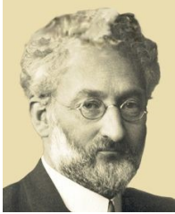
Karel de Bazel

Voor het grote publiek is Karel de Bazel (1869-1923) de architect van wat we tegenwoordig kennen als het de Bazelgebouw, aan de Vijzelstraat in Amsterdam. Hij tekende de plannen