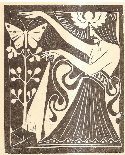
1. De natuurlijke ontwikkeling der mensheid

De techniek van de houtsnede is helemaal anders dan die van de ets. De etser beschikt over heel wat verschillende technieken, zowel qua instrument, als