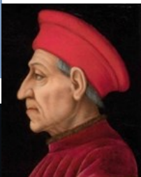
Cosimo de' medici en.wikipedia.org