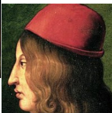
Giovanni Pico della Mirandola

De Renaissance wordt gezien als de periode waar het Latijnse Westen terug aansluiting vond bij zijn antieke Griekse verleden. Naast een literaire en artistieke wedergeboorte betekende het ook een filosofische wederopstanding door de herontdekking van de werken van Plato, de Neoplatonici en het Hermetisme. Een belangrijke rol in dit verhaal is weggelegd voor het Firenze van Cosimo de' Medici de Oude (1389-1464) en zijn Platonische academie. De val van Byzantium in 1453, het Concilie van Ferrara-