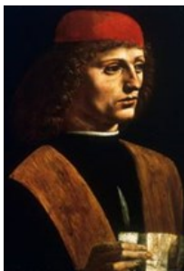
Marcilio Ficino ericgerlach.com