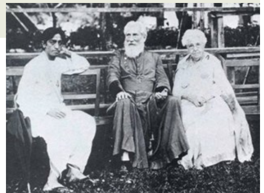
Krishnamurti, C.W. Leadbeater & Annie Besant