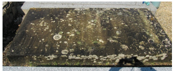
Graf S.U.Zanne na eerste schoonmaakbeurt

Inmiddels heeft de Academie van Mâcon me in contact gebracht met de voorzitter van Memoria, de vereniging die zich bezig houdt met het erfgoed van de begraafplaatsen van Mâcon. Deze heeft op haar beurt haar hulp toegezegd om samen met het stadsbestuur de mogelijkheden tot preservatie van het graf te onderzoeken.