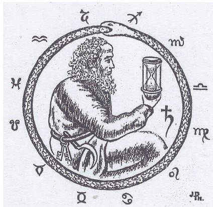
De slang OEROBOROS; symbool van cyclische evolutie

DIT WIL ECHTER NIET ZEGGEN DAT ER NIETS AAN DE HAND IS!!!!