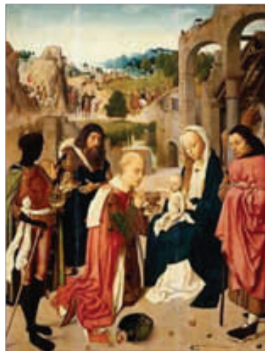
Aanbidding der Wijzen - +/- 1490 Geertgen tot Sint Jans

de pas ontwaakte kracht van universele liefde en van die geestelijke intuïtie die aan het denkvermogen de eenheid van alle leven en alle levende dingen ontsluit. Deze innerlijke geboorte is inderdaad onbevlekt, totaal innerlijk en geestelijk, want in deze uitleg van het evangelieverhaal vertegenwoordigt Jozef het formele, logische, concrete denken van een normaal ontwikkeld persoon. Hoe waardevol dit rechtmatige vermogen van het denken ook kan zijn, het kan de intuïtie niet tot leven brengen. Juist door zijn aard is het mentaal, analytisch en feitelijk. Daar