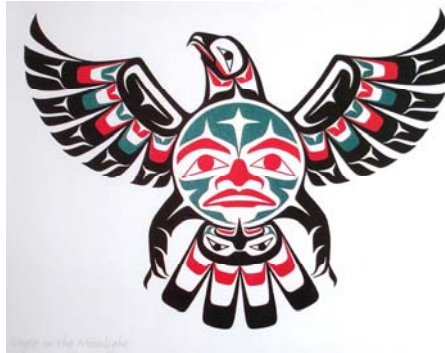
Eagle Moonlight (Keith Tait) http://store.northwesttribalart.com/keith-tait.html

pect wij ook hebben voor deze volkeren, hun tradities zijn niet de onze en als wij één ding beseffen over de inheemse religies, is dat ze voor buitenstaanders meestal onbegrijpelijk zijn.