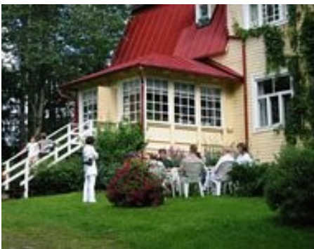
Hoofdgebouw Finse sectie Theosophical Society http://www.teosofinenseura.fi/tscongress/Kreivila.htm

In eerdere bijdragen in dit blad werden de internationale theosofische centra vernoemd, waarvan er slechts drie zijn in de wereld: The Manor (Australië – check), Ojai (VSA) en bij onze Noorderburen in Naarden. Naast deze ITC's beschikt The Theosophical Society in bepaalde landen nog over theosofische centra zonder dat deze het stempel ITC krijgen. Naast Tekels Park (Surrey, Engeland) is ook Kreivilä in Finland zo'n plek.