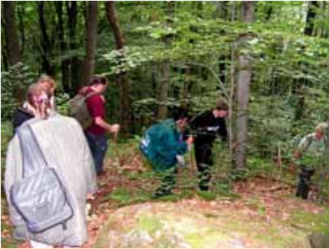
Loge Witte Lotus & co in de bossen van Wéris

Zondag 19 augustus 2007 was een scouting dag voor Loge Witte Lotus. Met enkele leden & familie en sympathisanten hebben we een prachtige wandeling gemaakt in de omgeving van Wéris, gekend om haar megalieten en dolmen.