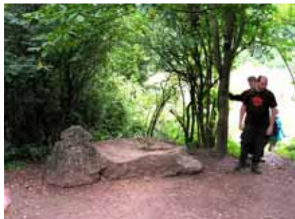
Bij 'le lit du diable' (Wéris)