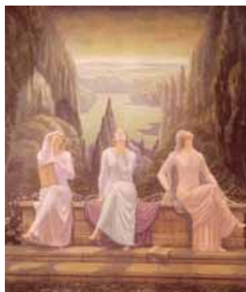
Jean Delville, De School der Stille