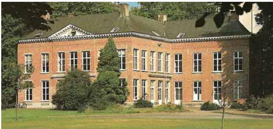
Het mooie faculteitsgebouw op de campus, Bist 164, 2610 Wilrijk