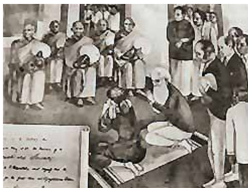
Olcott - "Pansil"

In juli 1882 kwam Olcott voor zijn derde reis door Sri Lanka. Hij ontdekte dat de Buddhist Theosophical Society levenloos was en dat de Revival geen vooruitgang meer boekte. Van de 13.000 roepies die het National Education Fund zou ontvangen, werden slechts 100 roepies geïnd. Maar meer verontwaardigd was, dat de Rooms Katholieke missionarissen, een Boeddhistisch pelgrimsoord hadden omgevormd tot een Christelijke, heilige, genezende plaats. Olcott vreesde