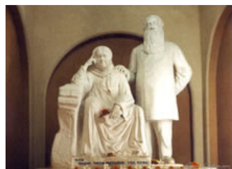
Het standbeeld in de hall

Adyar Dag wordt nog steeds gevierd. Het is niet enkel een dag om geld in te zamelen. Het is een dag in herinnering aan hen die ons voorgingen en aan hen die hun leven ten dienste stelden van de Theosofie.