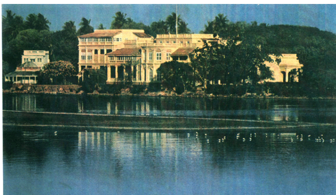
Het hoofdkwartier van de Theosofische Vereniging in Adyar

17 februari was oorspronkelijk de Olcott Dag. In herinnering aan de dood van Kolonel H. S. Olcott in 1907, kwamen leden jaarlijks samen aan het monument, opgericht ter zijner eer. Enkele woorden werden gesproken en bloemen neergelegd.