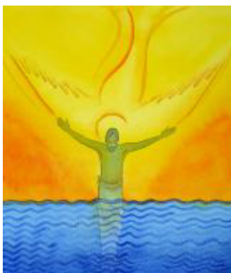
"Doop in de Jordaan" Elisabeth Wang © Radiant Light 2006, www.radiantlight.org.uk