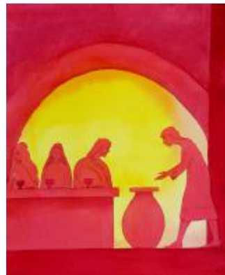
"Mirakel van Kana" Elisabeth Wang © Radiant Light 2006, www.radiantlight.org.uk

Rond het begin van onze jaartelling werd in Alexandrië een feest van Aioon gevierd, een god die het eeuwige licht vertegenwoordigde. In de nacht van 10 op 11 Tobi werd Aioon geboren uit de maagd (jonge vrouw) Kore. Op wanden van een oud Egyptisch schrijn is zelfs een voorstelling gevonden van de aanbidding van moeder en kind door drie Wijzen. 11 Tobi (6 januari) was ook een speciale dag voor doopplechtigheden. Op die dag zou namelijk de Nijl, waaraan het land zijn vruchtbaarheid en welvaart dankte,