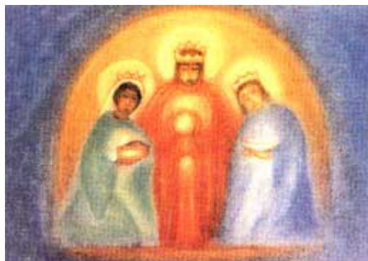
"Drie Wijzen"

Ofschoon de aanbidding van de drie wijzen de hoofdinhoud van het huidige Driekoningenfeest vormt, was er een oudere overlevering, die verband hield met het Licht dat aan de Jordaan verscheen ten tijde van de doop van Jezus. Gnostische christenen in Alexandrië, volgelingen van Basilides, vierden vanaf de 2de eeuw reeds de doop van Jezus, op de elfde dag van de Egyptische maand Tobi. Deze datum correspondeert met onze huidige 6de januari. Ze noemden dit feest "epiphaneia". Dit Griekse woord duidde op de