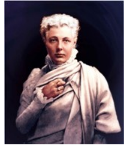
Uit: The Theosophist , juli 2010 Vertaling: Louis Geertman Theosofia sept. 2014

nederden omarmen met een hart vervuld van liefde, zullen we de glorie van God in elke menselijke vorm leren begrijpen en beseffen dat de liefde die bevrijdt, het kenmerk is van de Redders of Heilanden van de wereld die, zelf vrij, als enigen de boeien kunnen verbreken die anderen in ellende gekluisterd houden.