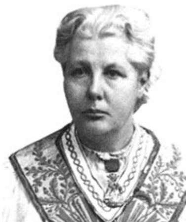
Annie Besant 01/10/1847-20/09/1933

Er kan geen sprake zijn van broederschap voordat je zelf broederlijk bent geworden. Men kan zonder broeders geen broederschap opbouwen, en dat is een zaak voor iedere individuele man en vrouw. Alleen als wij kunnen leren om in het dagelijkse leven op broederlijke wijze te leven, om iedereen om ons heen als broeder te beschouwen – het doet er niet toe of ze nu ouder, van gelijke leeftijd of jonger zijn, wij hebben immers betrekkingen met hen en daarom verantwoordelijkheden en verplichtingen naar hen toe – alleen wanneer we allemaal op zo'n wijze leven, kunnen we een broederschap vormen. Want plicht is niet een kwestie van contact, zoals teveel mensen denken: 'Hij helpt mij niet, dus waarom zou ik hem dan helpen?' Omdat hij u niet helpt zou u hem juist wél moeten helpen, want zo toon je hem de weg. Als hij ruw tegen u is, zou u tegenover hem niet ruw moeten zijn, maar zou u hem vriendelijkheid moeten leren door zelf vriendschappelijk te zijn; goedheid is net zo aanstekelijk of besmettelijk als ziektes dat kunnen zijn.