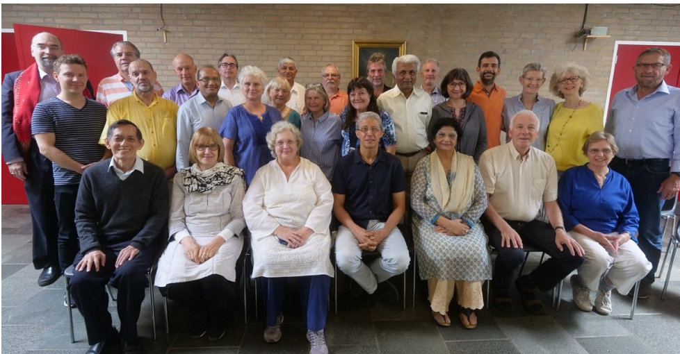
Deelnemers aan de General Council, Naarden juli 2018

Tegenwoordig worden veel dieren uitsluitend gefokt voor consumptiedoeleinden. De samenleving accepteert fabrieksfokkerijen als een manier om vlees te produceren. De mensheid zou inmiddels kunnen weten dat dieren emoties hebben en pijn kunnen voelen, dat sommige dieren zelfs een mate van zelfbewustzijn hebben en een gevoel van gerechtigheid. Dit wetende kan de TS zich niet afzijdig houden van het onbeschrijflijke leed dat wij onze jongere broeders en zusters aandoen. De TS kan zich als organisatie niet scharen achter welke beweging dan ook, maar kan wel helpen met het bevorderen van informatie en bewustwording rondom dit thema. De werkgroep heeft een conceptmanifest geschreven over dierenwelzijn: Een samenleving zonder enig dierlijk product zou ideaal zijn. Hoofdzakelijk vanwege het afschuwelijke lijden van dieren is een veganistisch dieet