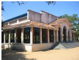
Olcott Memorial High School

Een groot project waar overeenstemming over is bereikt, is het opstarten van theosofische scholen in verschillende delen van de wereld. Als speciaal initiatief heeft de General Council besloten een theosofische school op te richten in Adyar, tot