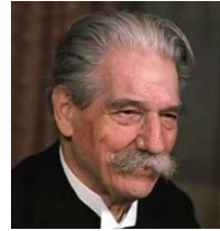
Albert Schweitzer 1875-1965

Het denkvermogen dat contact houdt met de realiteit moet omhoog kijken naar de hemel, het moet over de aarde kijken en zijn blik durven richten naar de getraliede ramen van een inrichting voor zwakzinnigen.