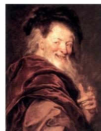
Democritus (ca. 460 - 370 v C.)