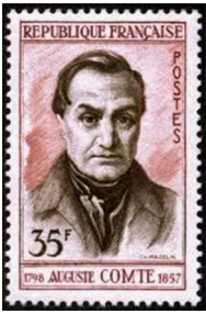
Auguste Comte (1798 – 1857)

de negentiende eeuw waren zo blij dat ze de antropomorfe god die hen eeuwenlang had achtervolgd, hadden gedood, dat ze verklaarden dat de wetenschap in staat was of zou zijn om alles uit te leggen, inclusief bewustzijn. Het was de tijd van de positivisten, met Auguste Comte als hun leidende figuur. Het duurde niet lang, maar lang genoeg om de materialistische levensfilosofie een vaste vorm te geven, tenminste binnen de wetenschappelijke gemeenschap. Dit was ook de periode waarin mevrouw Blavatsky (HPB) haar magnum opus De Geheime Leer publiceerde met in het voorwoord de volgende woorden: het doel van dit werk kan als volgt worden uiteengezet: aan te tonen dat de Natuur niet een 'toevallige samenloop van atomen' is en de mens zijn rechtmatige plaats binnen het bestek van het Universum te wijzen.