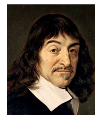
Descartes (1596 -1650)

komende tweeduizend jaar een hoeksteen van het westerse denken. De wetenschappelijke kennis werd gecodificeerd door Aristoteles die, met de zegen van de autoriteiten van de katholieke kerk, tot de vijftiende eeuw de enige referentie voor 'officiële wetenschappen' werd.