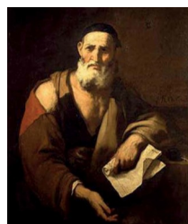
Leucippus (ca. 470 - 410 v C.)

Daarom worden de Griekse filosofiescholen gekenmerkt door een allesomvattende, holistische visie van de wereld. De Milesianen werden 'hylozoïsten' genoemd, oftewel 'zij die denken dat materie een levend wezen is', omdat zij geen onderscheid maakten tussen materie en geest. Vanaf die tijd verspreidden veel wijsheidsscholen dit soort kennis. Deze eenheid die alle tegengestelde krachten omvat en overstijgt (door Herakleitos 'logos' genoemd), begon te breken met de Eleatische scholen die een goddelijk principe boven de andere goden en mensen erkende. Vanaf dat moment sloop dualisme binnen. Een nieuw concept van onverwoestbare materie deed opgang. Atomistische filosofieën Leucippus en Democritus trokken een grens tussen geest en materie en dit werd de