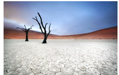
Kleivallei midden Namibwoestijn https://www.nieuwsblad.be

In zijn Oude Dagboekbladen (vooral in de eerste twee delen), beschrijft Olcott vele van deze 'maya's', die hij ook wel 'illusies' noemt, 'misleidingen', en 'begoochelingen'. In een hoofdstuk over 'Illusies' (deel I, 3), theoretiseert hij dat