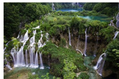
Plitvice watervallen in Kroatië

Dat wil zeggen, het is Atman, het Zelf, de onderliggende Realiteit van alle gemanifesteerde dingen, die hen hun intrinsieke waarde verleent. En bedenk dat in de Oepanisjads, Atman en