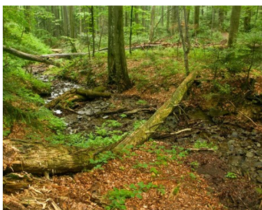
Oerbeukenbossen in de Karpaten en andere regio's in Europa

Met andere woorden, de gemanifesteerde wereld is: 1. niet permanent en 2. afhankelijk voor zijn bestaan van Brahman (gewoonlijk aangeduid als Parabrahman in De Geheime Leer). In de Indiase metafysica zowel als in de occulte filosofie betekent dit dat de gemanifesteerde wereld niet absoluut echt is - in de filosofische of metafysische zin van maya, een illusie is. Dit is zo omdat de criteria voor realiteit (sat of satta) zijn 1. permanentie (d.w.z. onveranderlijk zijn), 2. onafhankelijkheid (d.w.z. niet afhankelijk zijn van iets anders voor zijn bestaan), en 3. ervarbaarheid (d.w.z. in staat zijn ervaren te worden). De gemanifesteerde wereld voldoet alleen aan de derde van deze criteria, vandaar dat zij niet absoluut reëel is. Maar aan de andere kant is ze ook niet irreëel, hetgeen in de Indiase filosofie doorgaans wordt aangeduid als 'niet in staat om ervaren te worden in een van de