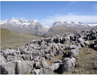
Sardona (tektonische arena) in Zwitserland

Misschien kunnen een paar voorbeelden mijn standpunt verhelderen. Stelt u zich voor dat u een