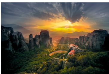
Meteora in Griekenland

Het belang van dit onderscheid tussen illusie en begoocheling ligt in de psychologische analyse van de laatste. Hierin heeft de Indiase psychologie inzichten die westerse filosofie en psychologie missen. Ten eerste, als iemand bijvoorbeeld een touw aanziet voor een slang, moet er feitelijk een touw zijn dat je kunt waarnemen. Dit wordt het substraat (adhishtana) van de begoocheling genoemd. De Indiase filosofie wijst erop dat zelfs dromen een substraat hebben: het verstand. Ten tweede, de begoocheling betreft twee processen in het bewust-